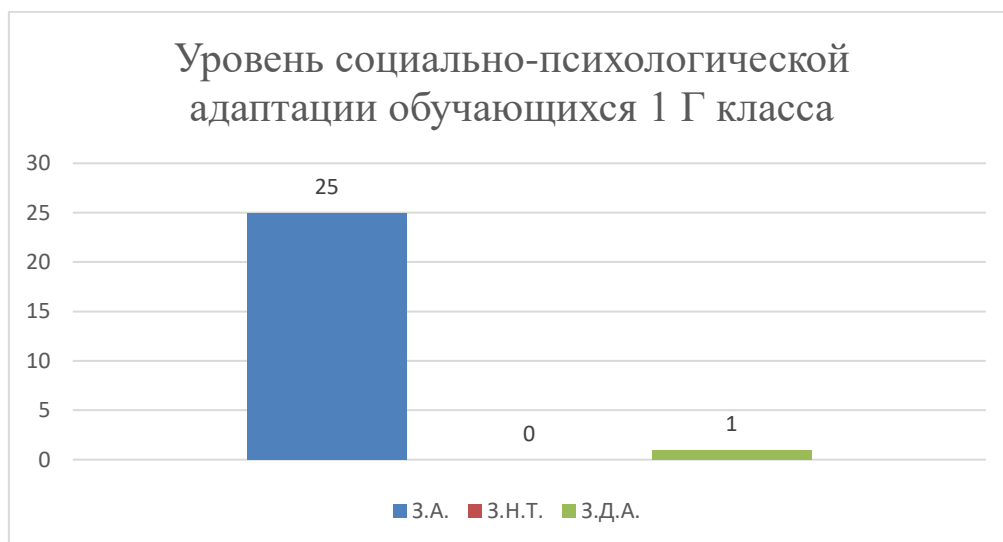
Рис.4. Результаты диагностики социально-психологической адаптации учащихся 1Г класса МБОУ «СОШ № 89г. Челябинска»

Таким образом можно представить социально-психологическую адаптацию параллели 1-х классов в виде таблицы